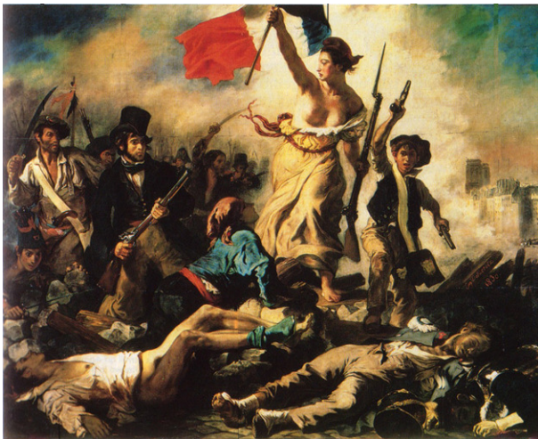
Revolución francesa de 1789

La autoridad de los Estados resultaba de la voluntad de los ciudadanos, que quedarían desligados del deber de obediencia en cuanto sus gobernantes conculcaran esos