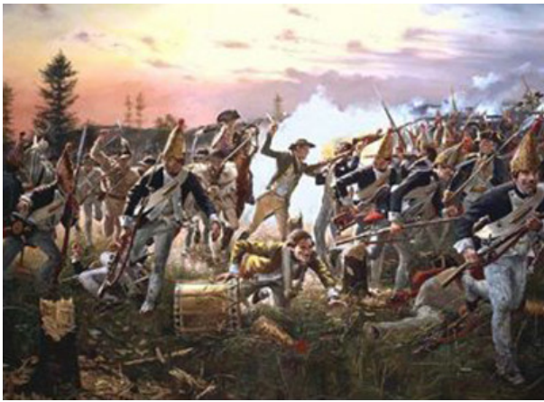
Revolución norteamericana de 1776

Lo escrito por Locke se convirtió en la primera garantía de los derechos y libertades constitucionales, si un gobierno dispone de la libertad o de la propiedad de los ciudadanos sin su consentimiento, puede ser destituido (precisamente lo que ocurriría con las colonias norteamericanas, cuyo gobierno no contaba con la aprobación de sus ciudadanos); lo que justifica a su vez la Revolución norteamericana de 1776 y la Revolución francesa de 1789. Las formulaciones de Locke –1664– son tomadas casi al pie de la letra en el Acta de Declaración de Independencia de USA, y es la base de la civilización política que todos reconocemos y consideramos como nuestra.