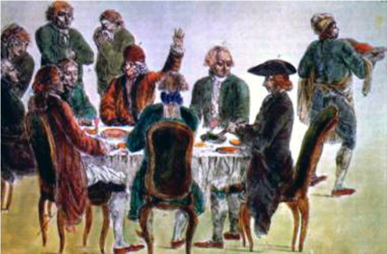
John Locke · Montesquieu · Jean-Jacques Rousseau · Emmanuel-Joseph

La ley moral natural proclama, al mismo tiempo, la existencia de unos derechos naturales y sus deberes correspondientes. Entre ellos, Locke destaca el derecho a la propia conservación, a defender: su vida, a la libertad, y a la propiedad privada.